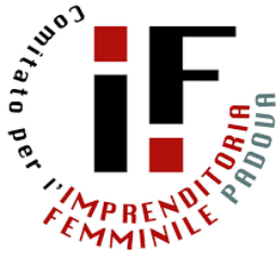
Tavola rotonda Vita familiare e lavoro: come conciliarli?

Strumenti e buone prassi alla prova dei fatti nella tavola rotonda organizzata dal Comitato Imprenditoria Femminile di Padova, domenica 22 maggio dalle ore 10 alle ore 12 alla Fiera Campionaria - Padiglione 1 - Arena 4.0.